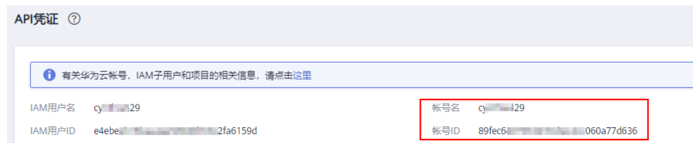
图 7-2 查看账户名和账户 ID