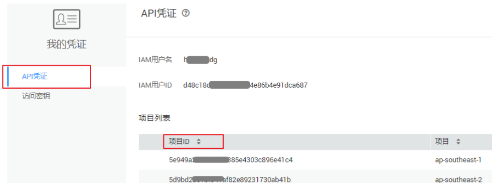
图 7-1 查看项目 ID